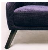
опора №2(бук) Модерн