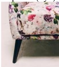
Опора №1(бук) Винтаж